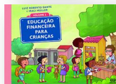
EDUCAÇÃO FINANCEIRA PARA CRIANÇAS Volume 01 Autores: Luiz Roberto Dante e Iraci Muller Editora Ática