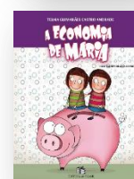
A ECONOMIA DE MARIA Autora: Telma Guimarães Castro Andrade Ilustrações: Silvana Rando Editora Brasil