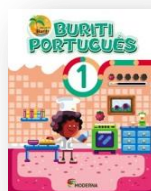
BURITI PORTUGUÊS 1 Projeto Buriti Editora Moderna