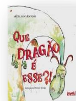
QUE DRAGÃO É ESSE? Autor: Alexandre de Azevedo Editora Lazuli