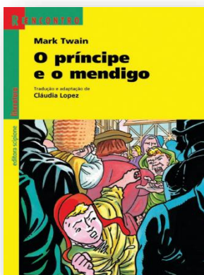
O PRÍNCIPE E O MENDIGO Autor: Mark Twain Editora Scipione