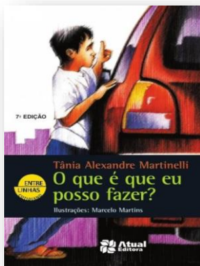
O QUE É QUE EU POSSO FAZER? Autora: Tânia Alexandre Martinelli Ilustrações: Marcelo Martins Editora Atual